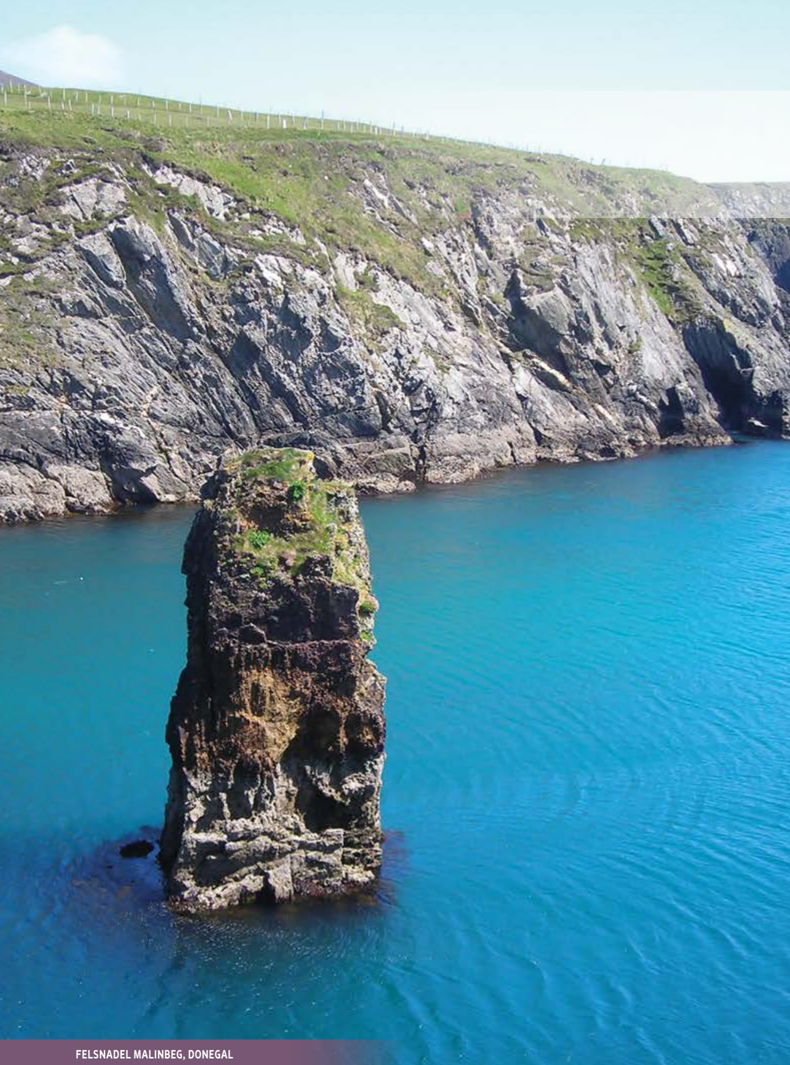
FELSDADEL MALINBEG, DONEGAL